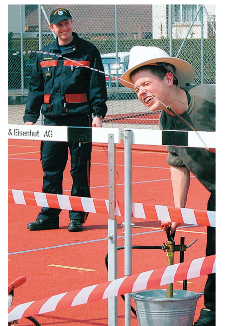
Der Einsatz mit der kleinen Eimerspritze.